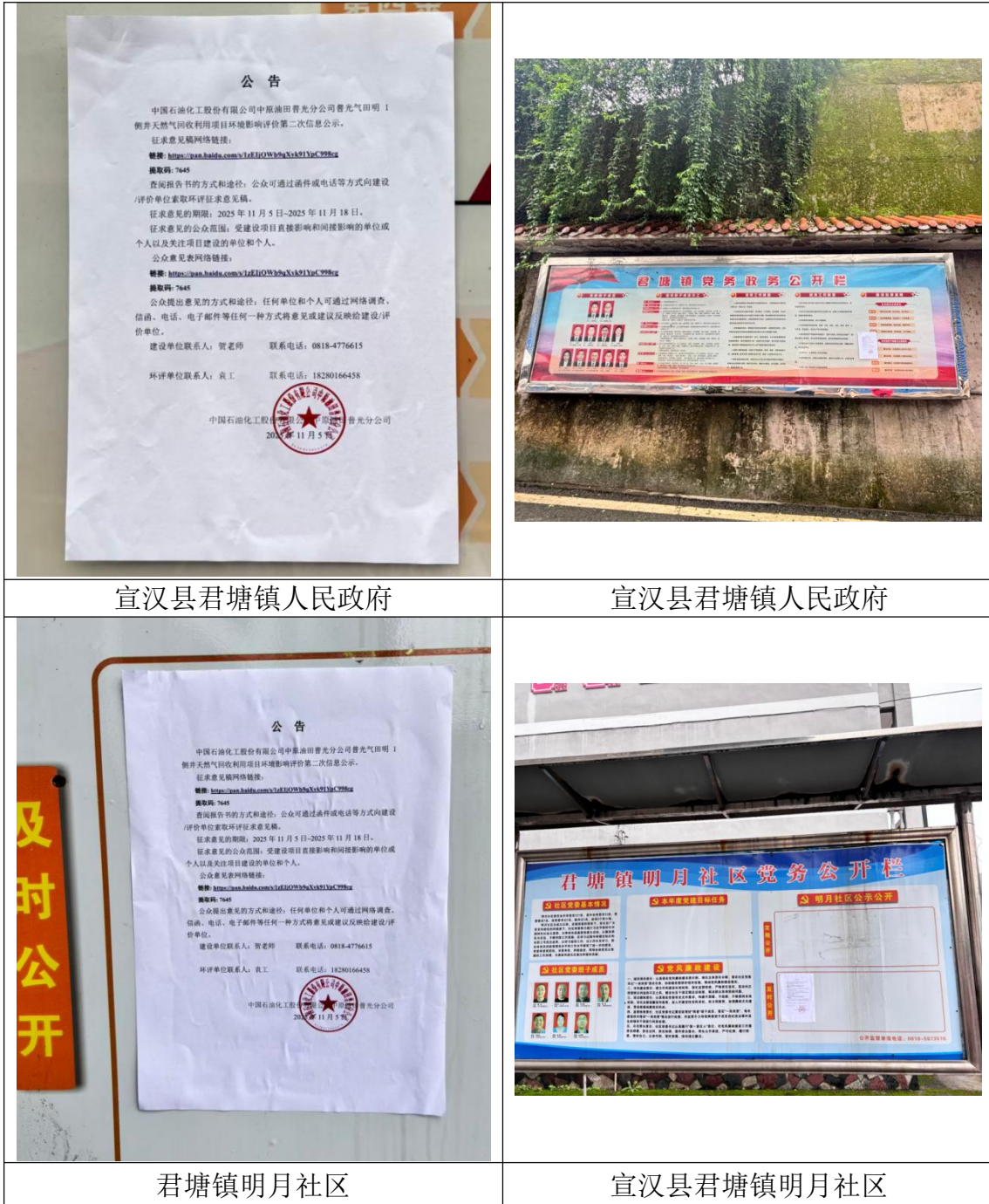
宣汉县君塘镇人民政府