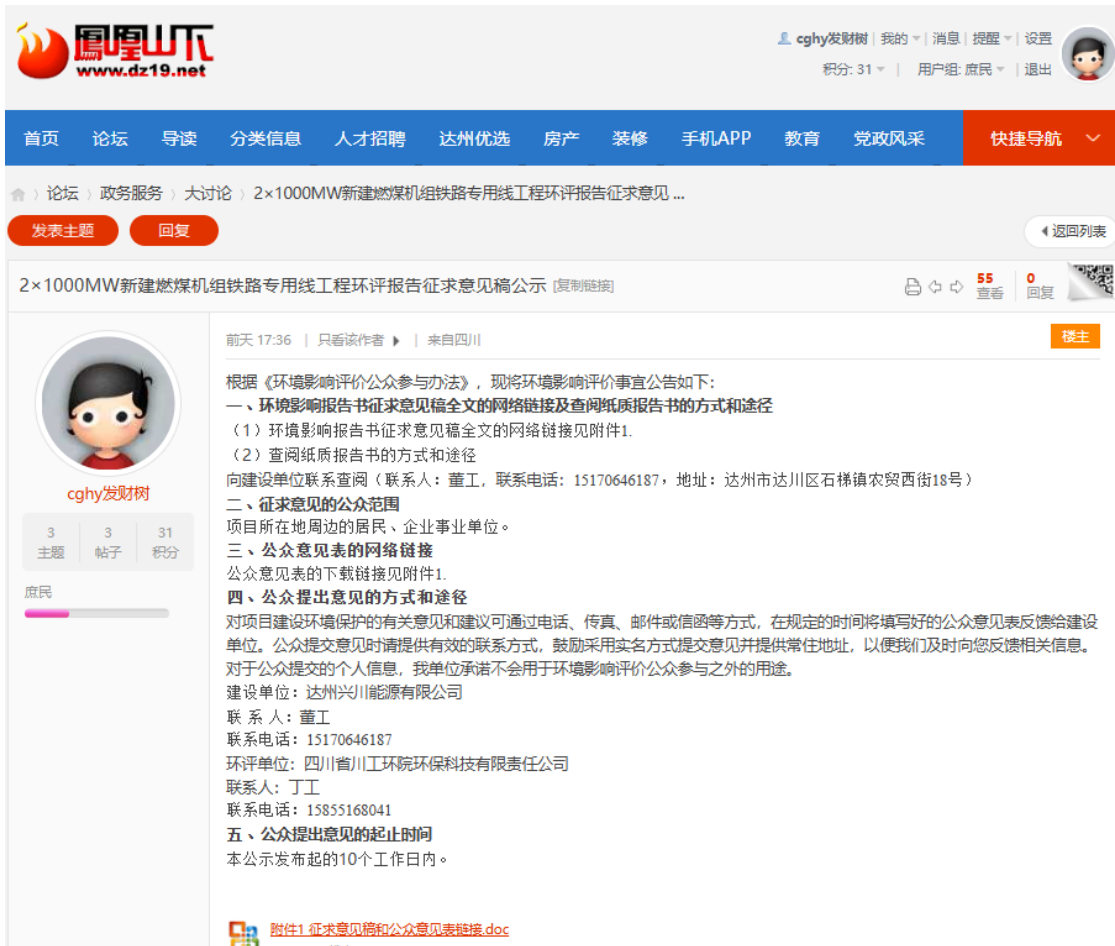
图 3-1 第二次网络公示截图