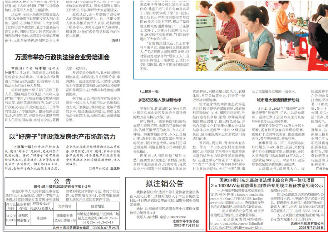
图 3-2 第一次报纸公示截图

2025年7月25日、7月28日，建设单位在达州日报上进行了两次登报公示，《达州日报》是一份城市主流人群的生活日报，为项目所在地公众易于接触的报纸，公示的载体符合《环境影响评价公众参与办法》的要求。