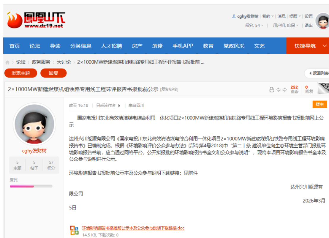
图 5-1 网站全本公示截图

2026 年 3 月 5 日，向生态环境主管部门提交本项目环境影响报告书前，在达州当地的凤凰山下网站上（ https://www.dz19.net/thread-2181612-1-1.html ）对本项目拟报批的环境影响报告书全文和公众参与说明进行了网络公示，公示的载体符合《环境影响评价公众参与办法》（部令第 4 号）的要求。网页页面截图见图 5.2-1。