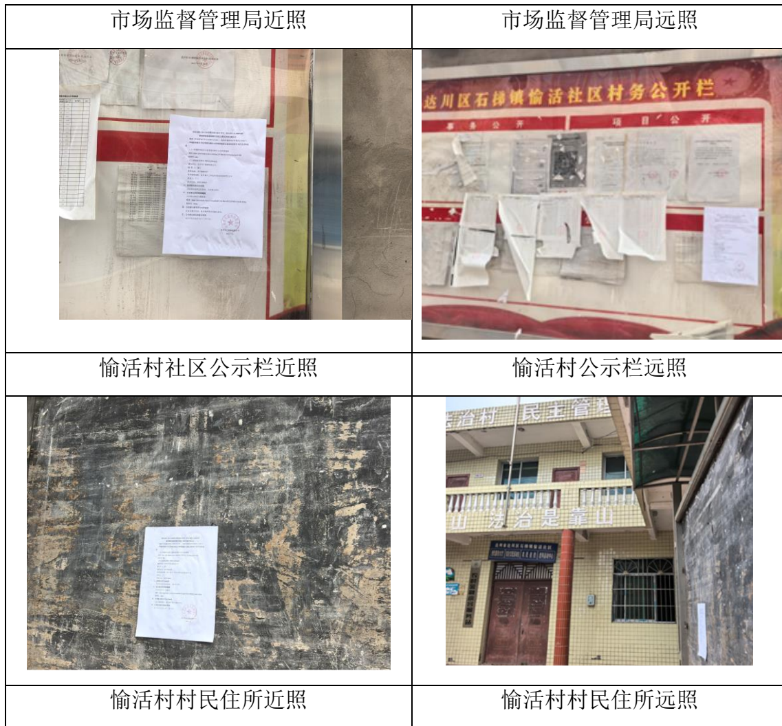
图 3-4 现场张贴公示照片