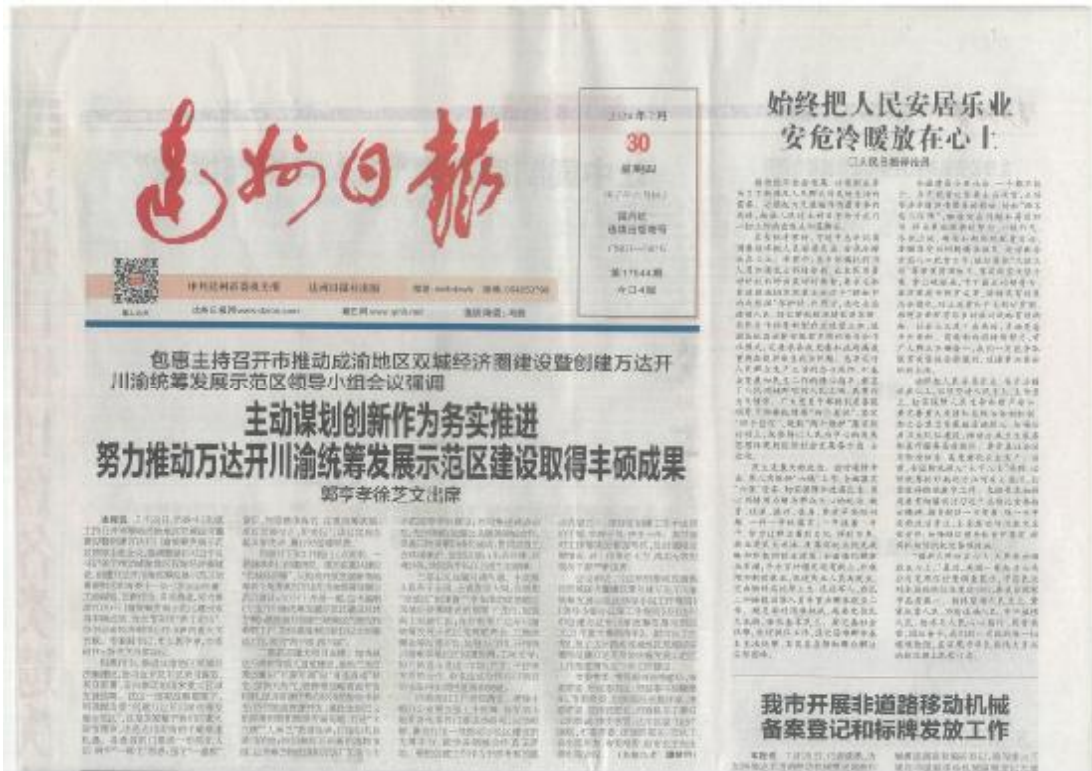
图3 2020年7月30日报纸公示截图