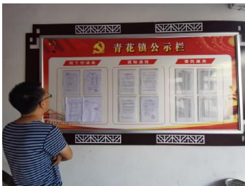
图 5 现场张贴照片