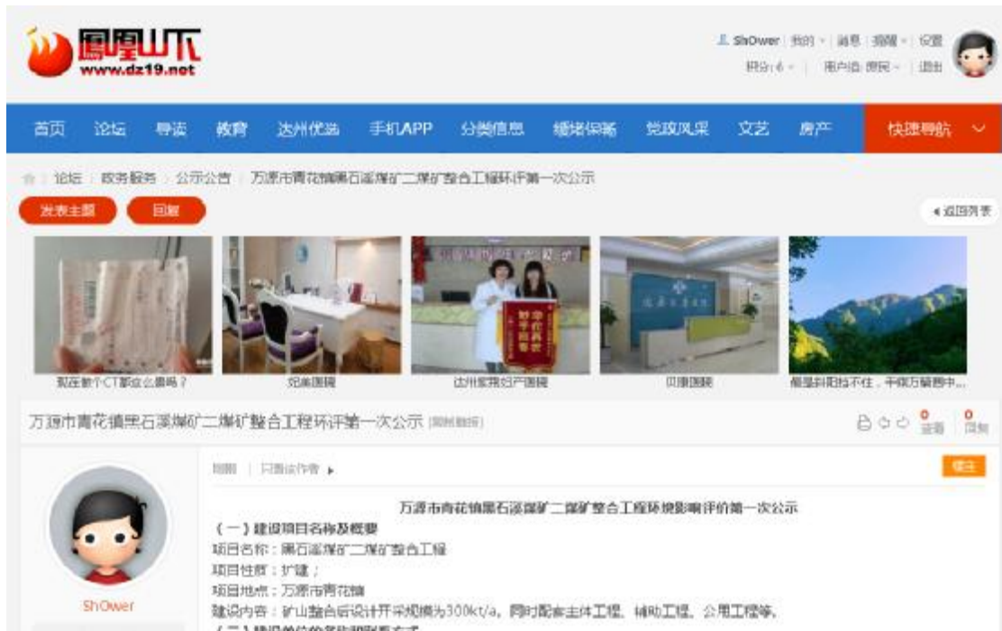
图 1 本项目第一次公示截图